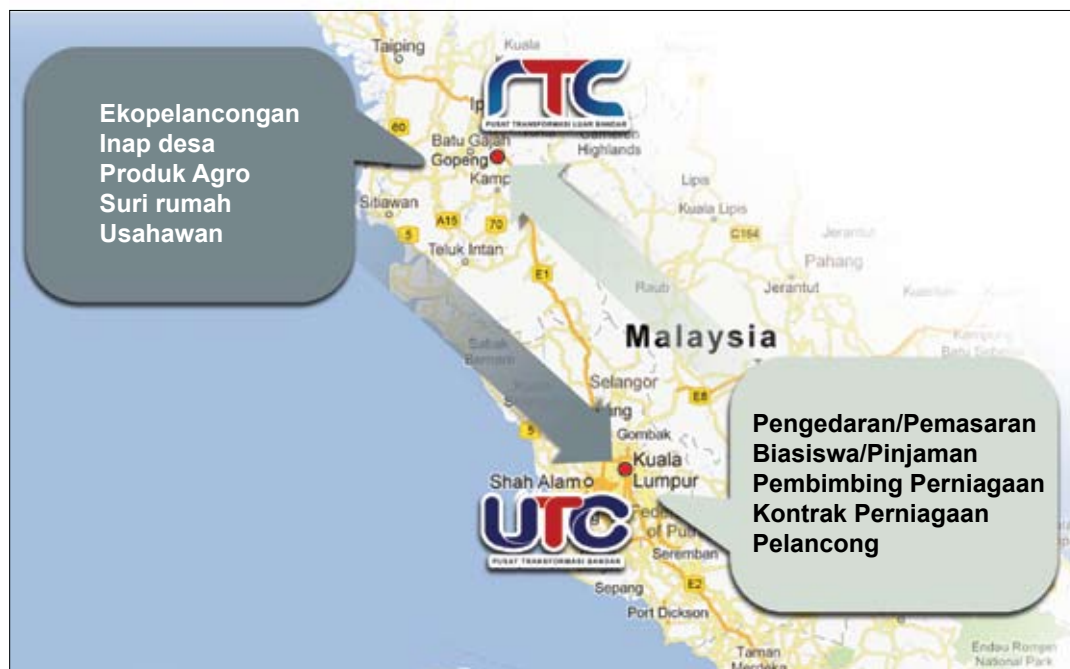
CARTA 2 Hubungkait antara RTC dan UTC

Selain daripada meningkatkan kualiti perkhidmatan kepada komuniti bandar dan luar bandar, penubuhan RTC dan UTC adalah langkah strategik bagi mengembangkan permintaan untuk produk domestik, terutamanya produk luar bandar. Sebagai contoh, usahawan di kawasan luar bandar yang terlibat dalam program inap desa dan ekopelancongan akan dapat memasarkan perkhidmatan mereka secara langsung kepada penduduk bandar dan pelancong di UTC. Pada masa yang sama, usahawan bandar juga dapat menambah nilai kepada aktiviti ini dengan menyediakan perkhidmatan sokongan seperti pemasaran serta bimbingan perniagaan dan mentor kepada usahawan di kawasan luar bandar. Potensi untuk kerjasama tersebut adalah tidak terhad dan rakyat berupaya untuk menggunakan sepenuhnya peluang tersebut dalam membantu meningkatkan pendapatan penduduk bandar dan luar bandar.