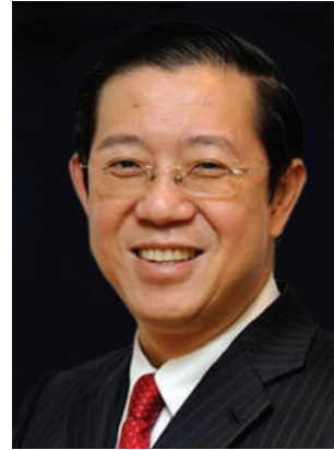
MENTERI KEWANGAN MALAYSIA